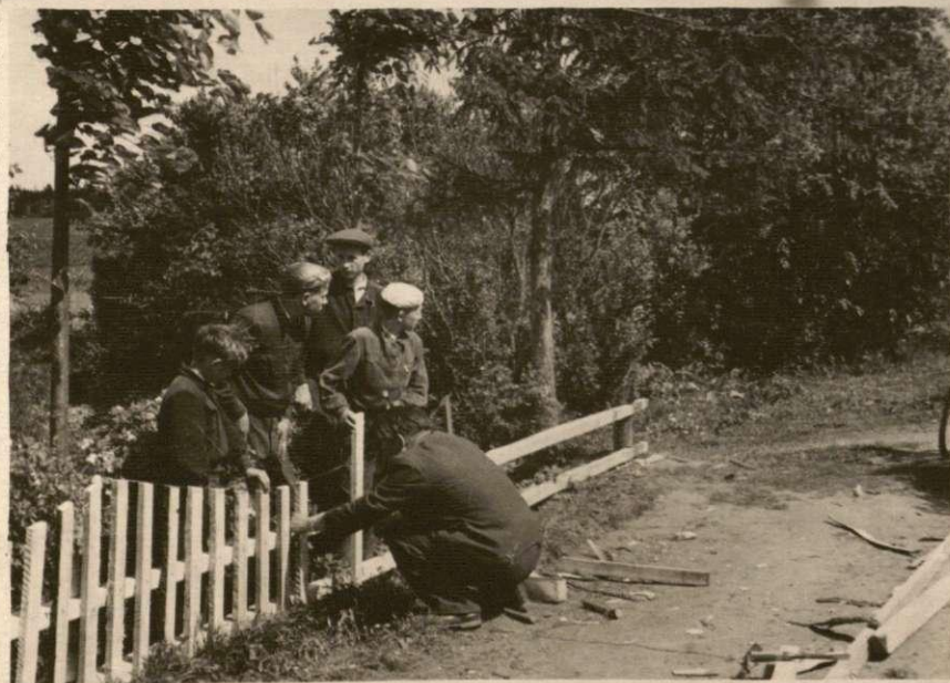
Sustiprėjo mokyklos politechninio la.