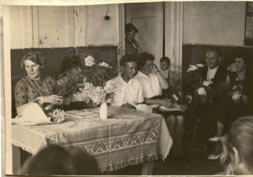
Momentas iš 1963/64 m. m. uėbai- gimo iškilmingo atėo.